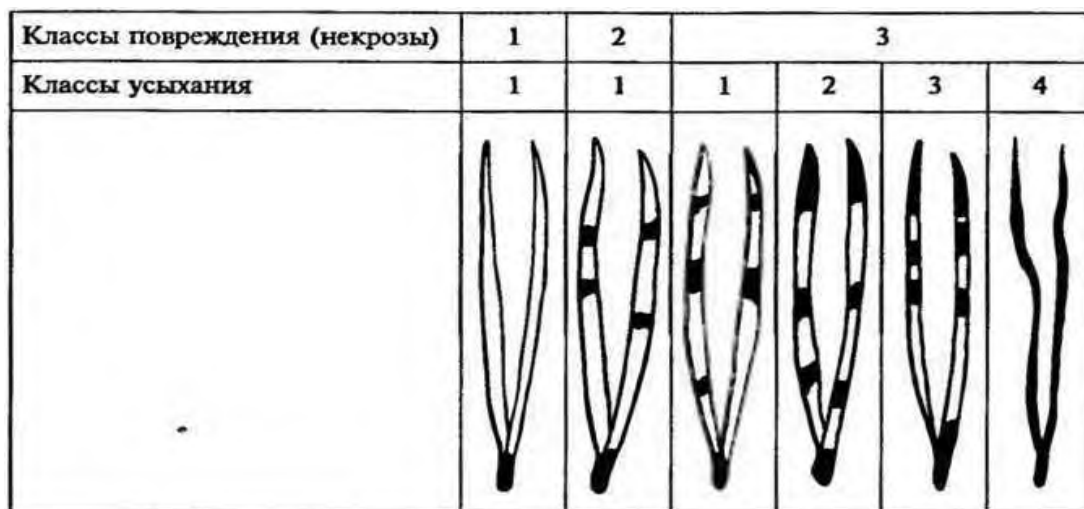
Рис. 3. Классы повреждения и усыхания хвои