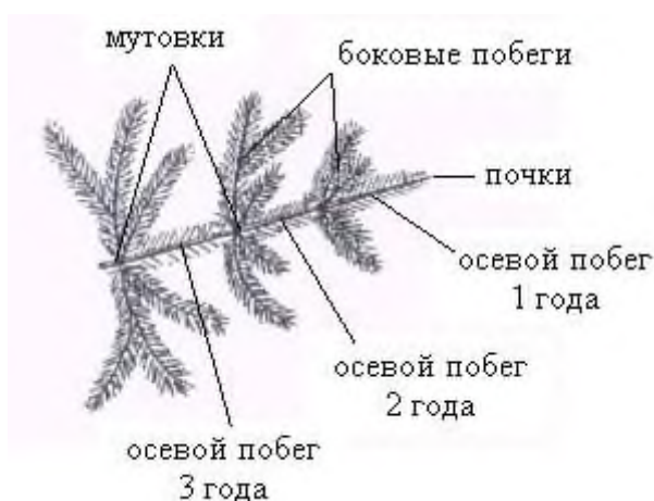
Рис.1. Части ветви хвойного дерева служащие биоиндикаторами

4. На высоте своего роста собрать с каждого дерева (1 дерево в одной точке) по 30 хвоинок (суммарно 150 хвоинок). Хвоинки должны быть в возрасте 2 лет, то есть надо брать образцы хвои с побегов второго года жизни – для всех точек одинаково рис.1.