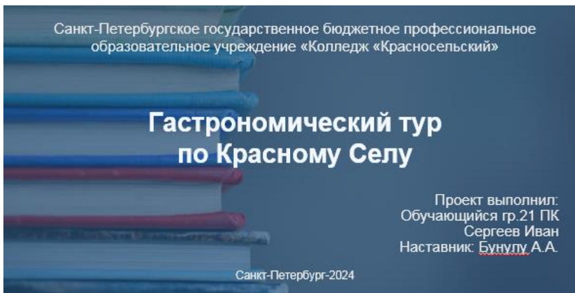
Рисунок 4.5 – Пример оформления титульного листа презентации

Все иллюстрации, диаграммы, фотографии в презентации должны соответствовать содержанию учебного проекта и выступать в качестве наглядного пособия для защиты проекта. Количество текста на слайдах презентации должно быть минимально. Презентация: в среднем 10 слайдов.