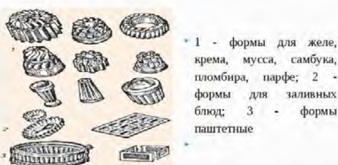
Рис. 24. Инвентарь, используемый в холодном цехе:

Инвентарь и приспособления, используемые в холодном цехе: 1 - ножи гастрономические: а - филейные; б - гастрономический (колбасный); в - для нарезки ветчины; г - кухонные; д - с двумя ручками для нарезки сыра и масла; е, ж - с одной ручкой для нарезки сыра и масла; з - для фигурной нарезки масла; и - нож-вилка; 2 - томаторезки ручные; 3 - яйцерезки; 4 - приспособление для нарезки сыра; 5 - ручной делитель масла; 6 - скребок для сливочного масла; 7 - доска разделочная; 8 - доска для нарезки лимонов; 9 - соковыжималки ручные; 10 - горка для гарниров; 11 - лотки для заливных блюд; 12 - формы для паштетов, заливных и сладких блюд; 13 - лопатка-нож для раскладывания заливных блюд; 14 - лопатка для раскладывания порционных блюд; 15 - вилки производственные для раскладывания блюд; 16 - приборы для раскладывания блюд: а, б, в - приборы салатные; г - прибор для консервированных фруктов; д - щипцы для раскладывания порционных блюд.