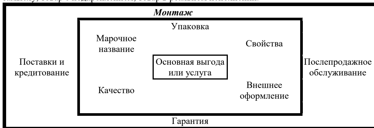
Рис. 2. Характеристика уровня товаров

На рис. 2 изображены три уровня товара с соответствующими характеристиками каждого уровня. По имеющимся характеристикам определите название каждого уровня: товар по замыслу; товар с подкреплением; товар в реальном исполнении.