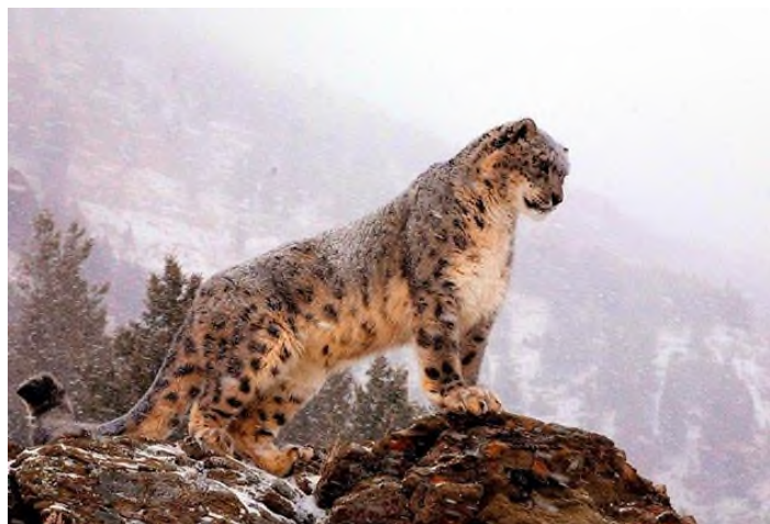
Рис. 1 Ирбис (снежный барс)

Снежный барс – это крупная кошка, которая живет высоко в горах, где круглый год лежит снег. Окрас шерсти барса серовато-дымчатого оттенка, но контраст с черными пятнами создает впечатление белой шерсти. Для черных пятен характерна розеточная форма. Иногда в центре пятна можно разглядеть еще одно, более темное, но меньше размером. По особенностям пятен ирбис напоминает чем-то ягуара. В определенных местах (шея, конечности)