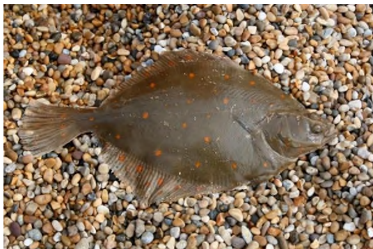
Рис. 4. Камбала

Семейство камбаловых представляет собой класс лучеперых рыб. Этим рыб называют правосторонними камбалами, т.к. их глаза располагаются по правую сторону головы. Обтекаемая форма тела способствует быстрому передвижению животных и в водной среде и сглаживают его форму. Связи с переходом на донный образ жизни, тело камбалы уплощенная. Донные рыбы обычно окрашены под цвет песчаного дна (скаты и камбалы). При этом камбалы обладают