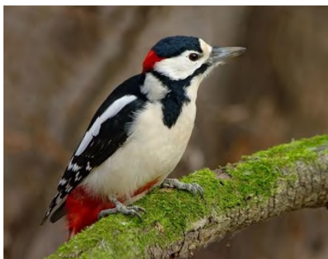
Рис.5 Дятел пестрый.

Пёстрый дятел является самым распространенным представителем семейства дятловых. Он населяет большую часть лиственных, смешанных лесов в разных странах с теплыми, умеренными климатическими условиями. Это довольно шумные, крикливые птицы. Их невозможно не заметить из-за яркого оперения, характерной красной шапочки.