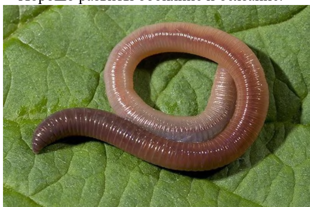
Рис. 3. Дождевой червь

любом направлении — ворс свободно ложится и вперёд, и назад. Окрас у крота однотонный, чёрный, чёрно-бурый или тёмно-серый. Линька происходит 3 раза в год: весной, летом и осенью. Конечности укороченные, передние лапы лопатообразно расширены; когти крупные, уплощённые сверху. Задние конечности обычно слабее передних. Хвост короткий. Голова небольшая, удлинённая. Нос вытянут в подвижный хоботок. Шея снаружи почти не заметна. Ушные раковины отсутствуют. Глаза неразвиты — лишены хрусталика и сетчатки, а глазные отверстия крошечные, закрытые подвижными веками; у некоторых видов глаза зарастают. Хорошо развиты обоняние и осязание.