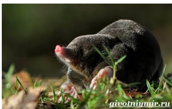
Рис. 2 Крот обыкновенный

Средний срок жизни. При благоприятных условиях снежные барсы могут прожить до 20 лет. А в зоопарках, где они меньше подвержены травмам, болезням, едят регулярно, ирбисы доживают и до 28 лет.