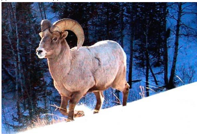
Рис.2 Снежный баран

Средний срок жизни. При благоприятных условиях снежные барсы могут прожить до 20 лет. А в зоопарках, где они меньше подвержены травмам, болезням, едят регулярно, ирбисы доживают и до 28 лет.