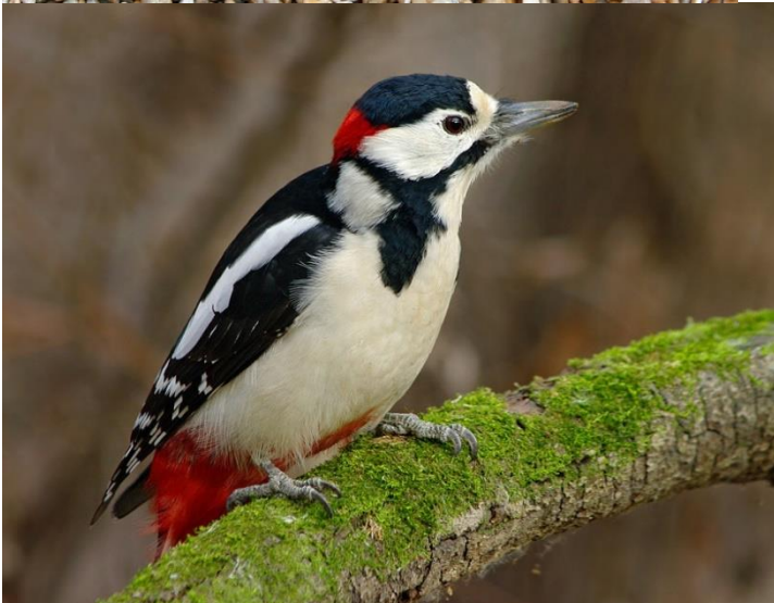
Рис.6 Дятел пестрый.

Обтекаемая форма тела способствует быстрому передвижению животных и в водной среде и сглаживают его форму. Связи с переходом на донный образ жизни, тело камбалы уплощенная. Донные рыбы обычно окрашены под цвет песчаного дна (скаты и камбалы). При этом камбалы обладают ещё способностью менять окраску в зависимости от цвета окружающего фона.