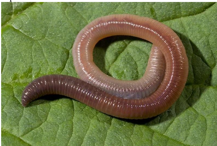
Рис. 4. Дождевой червь

Кроты — насекомоядные мелких и средних размеров: длина тела от 5 до 21 см; вес от 9 до 170 г. Они приспособлены к подземному, роющему образу жизни. Туловище у них вытянутое, округлое, покрытое густым, ровным, бархатистым мехом. Кротовая шубка имеет уникальное свойство — её ворс растёт прямо, а не ориентирован в определённую сторону. Это позволяет кроту легко двигаться под землёй в любом направлении — ворс свободно ложится и вперёд, и назад. Окрас у крота однотонный, чёрный, чёрно-бурый или тёмно-серый. Линька происходит 3 раза в год: весной, летом и осенью. Конечности укороченные, передние лапы лопатообразно расширены; когти крупные, уплощённые сверху. Задние конечности обычно слабее передних. Хвост короткий. Голова небольшая, удлинённая. Нос вытянут в подвижный хоботок. Шея снаружи почти не заметна. Ушные раковины отсутствуют. Глаза неразвиты — лишены хрусталика и сетчатки, а глазные отверстия крошечные, закрытые подвижными веками; у некоторых видов глаза зарастают. Хорошо развиты обоняние и осязание.