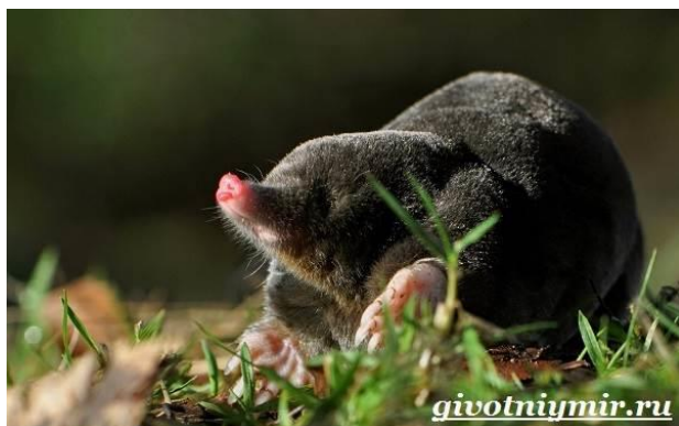
Рис. 3 Крот обыкновенный

Средняя продолжительность жизни барана в естественных условиях колеблется от 7 до 12 лет, хотя отдельные особи доживают до 15 лет. В неволе бараны живут 10-15 лет, а при хорошем уходе могут дожить до 20 лет.