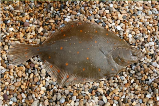
Рис. 5. Камбала

Кожа покрыта слизью, что уменьшает трение, и облегчает дыхание, наличие щетинок на брюшной стороне, помогает передвигаться, наличие кольцевых и продольных мышц, что позволяет передний конец с помощью кольцевых мышц сделать тонким и протиснуть в щели в почве и закрепляясь щетинками и подтягивая задний конец и утолщаясь двигается вперед. При необходимости в плотной почве он проедает себе дорогу, пропуская почву через пищеварительный тракт. Не имеет органов зрения.