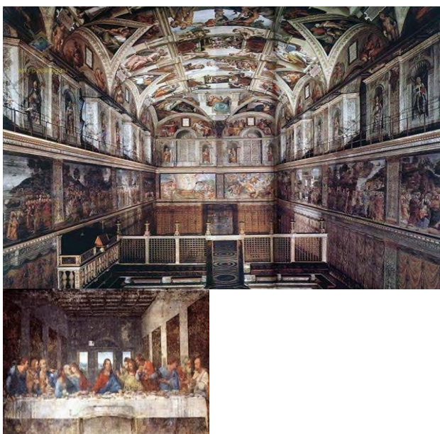
Тайная вечеря. Леонардо да Винчи.

Подведение итогов. Афиширование результатов.