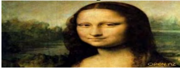
Мона Лиза (Джоконда) Леонардо да Винчи Микеланджело Буанаротти. Купол Св. Петра в Риме