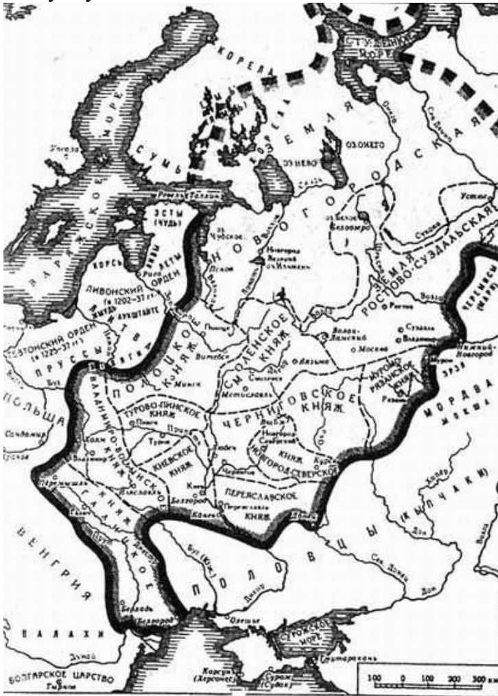
72. Русские княжества в XII в.

Если в старых городах, Ростове и Суздале, князьям приходилось считаться с влиянием сильного боярства, то в молодых центрах - Владимире и Ярославле - они опирались на растущие городские сословия, купечество, ремесленников, мелких землевладельцев, получивших землю за службу князю.