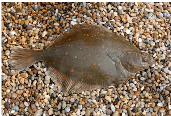
Рис. 4. Камбала

Дождевые черви относятся к подотряду малощетинковых червей. Кожа покрыта слизью, что уменьшает трение, и облегчает дыхание, наличие щетинок на брюшной стороне, помогает передвигаться, наличие кольцевых и продольных мышц, что позволяет передний конец с помощью кольцевых мышц сделать тонким и протиснуть в щели в почве и закрепляясь щетинками и подтягивая задний конец и утолщаясь двигается вперед. При необходимости в плотной почве он проедает себе дорогу, пропуская почву через пищеварительный тракт. Не имеет органов зрения.