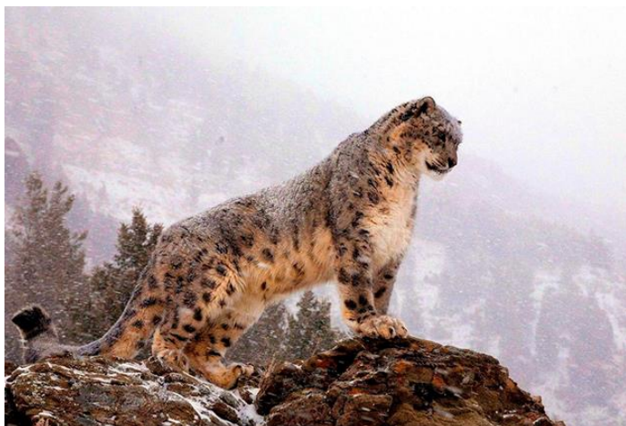
Рис. 1 Ирбис (снежный барс)

Снежный барс – это крупная кошка, которая живет высоко в горах, где круглый год лежит снег. Окрас шерсти барса серовато-дымчатого оттенка, но контраст с черными пятнами создает впечатление белой шерсти. Для черных пятен характерна розеточная форма. Иногда в центре пятна можно разглядеть еще одно, более темное, но меньше размером. По особенностям пятен ирбис напоминает чем-то ягуара. В