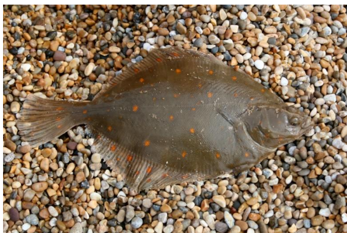
Рис. 4. Камбала

Семейство камбаловых представляет собой класс лучеперых рыб. Этим рыбам называют правосторонними камбалами, т.к. их глаза располагаются по правую сторону головы. Обтекаемая форма тела способствует быстрому передвижению животных и в водной среде и сглаживают его форму. Связи с переходом на донный образ жизни, тело камбалы уплощенная. Донные рыбы обычно окрашены под цвет песчаного дна (скаты и камбалы). При этом камбалы обладают ещё способностью менять окраску в