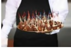
Waiter with food on tray

Passed-tray service typically occurs in lieu of a traditional meal. With this type of service, the waitstaff circulates through the banquet room with finger foods on large platters. The servers approach guests and offer food and a napkin. The service typically operates continuously for a block of time, and a full meal may not be served.