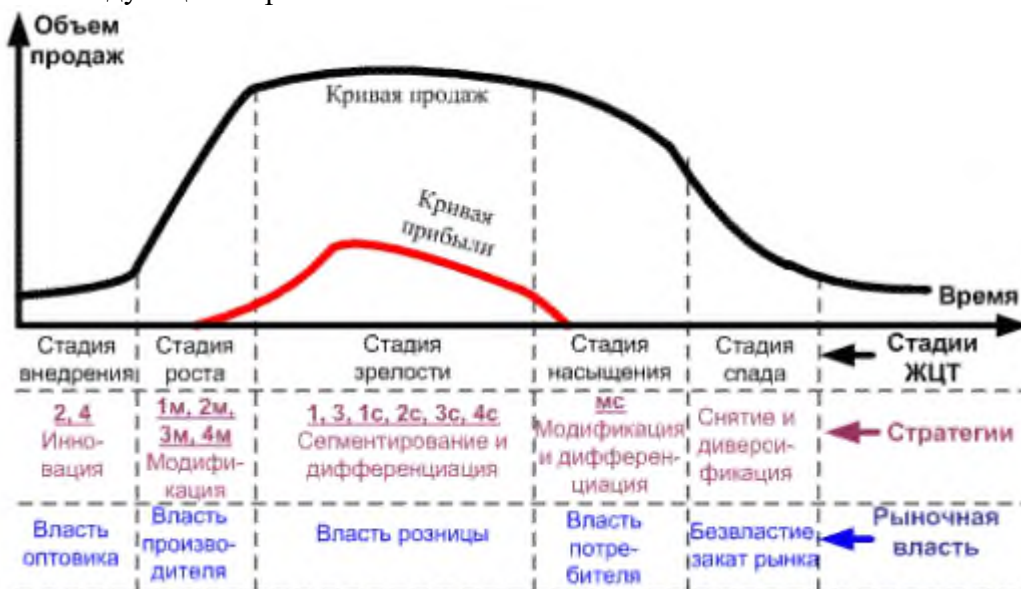
Рисунок 2.1 Стадии жизненного цикла товаров

Слово «Рисунок» и наименование помещают после пояснительных данных и располагают следующим образом: