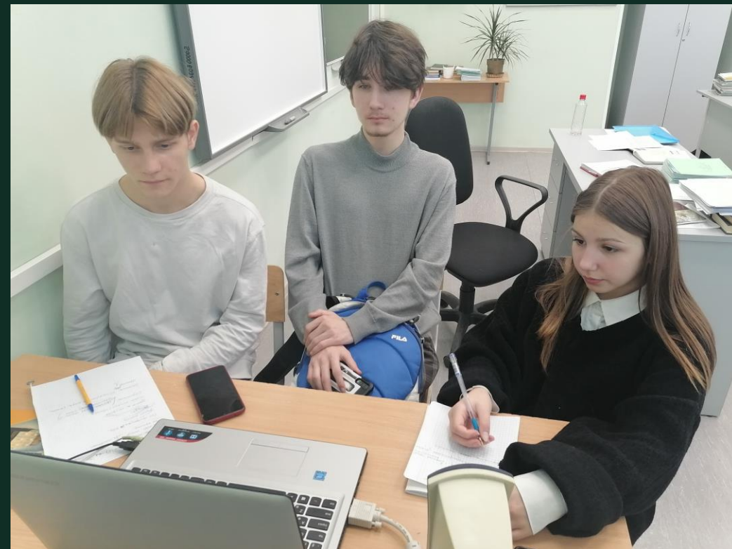
ДОП «ПРЕДПРИНИМАТЕЛЬСКОЕ МЫШЛЕНИЕ»