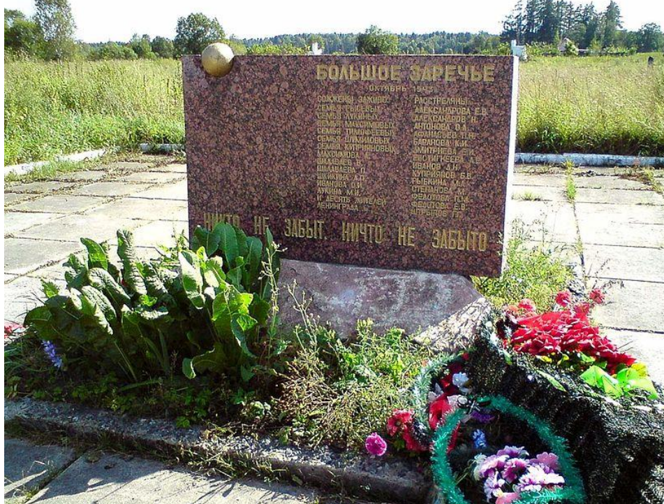
месте сожжённой ленинградской деревни.

Война страшна и беспощадна, невозможно смириться с убийством людей, какими бы лозунгами оно ни прикрывалось. Но нет никакого оправдания солдату, воюющему с мирным населением. Такие действия называются однозначно – преступление. Они не заслуживают прощения и не имеют срока давности. И пусть ещё одним напоминание об этом станет мемориал на